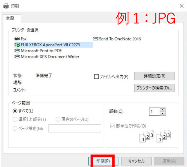
例 1 : JPG

④印刷 いんさつ 画面で出力 しゅつりょく したい設定 せってい (サイズ、カラー/モノクロ、両面 りょうめん 印刷 いんさつ など)にし、「印刷」ボタンをおしてプリントする。