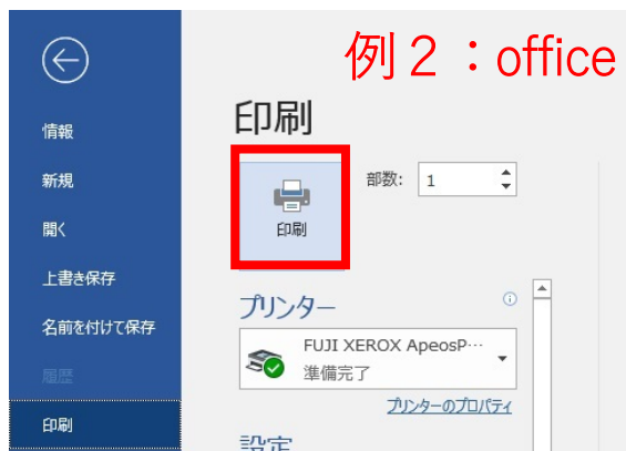
例 2 : office