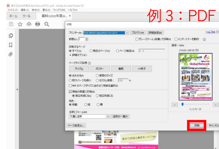
例 3 : PDF